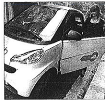
Pour les habitants, l'autopartage est un bon compromis.

De plus, les habitants se sont portés candidats à des expérimentations sur les voitures électriques. Ils souhaiteraient ainsi accueillir les bornes de recharge de ces