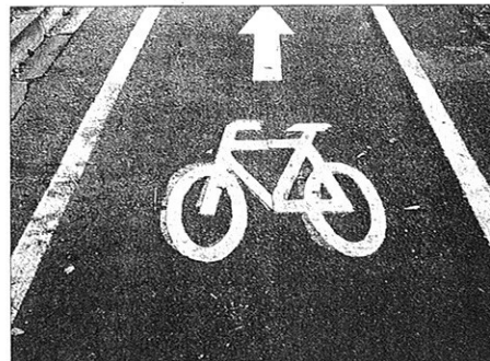
L'Union de quartier Jean-Macé propose « de favoriser la pratique du vélo dans toutes les rues par des aménagements, des parkings et une signalétique appropriée.

Mais, les habitants du quartier Jean-Macé proposent de leur en adjoindre